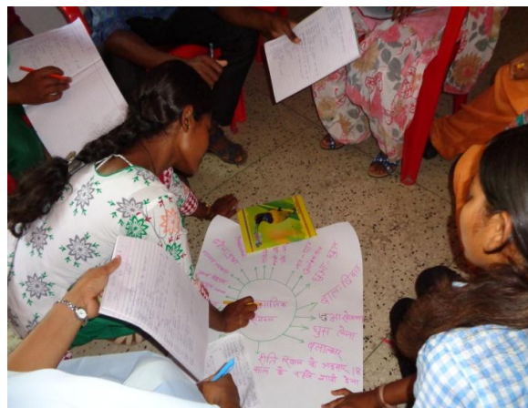
Adolescenten volgen sessies in het Vikas Bharti trainingscentrum, Jamshedpur

gedragsverandering, communicatie, levenskunst-ervaring, kennis over HIV/AIDS, seksueel overdraagbare infecties en ziekten." Deze adolescenten zijn zeer tevreden elkaar te kunnen ontmoeten en veel te leren over zaken die belangrijk zijn in hun leven" besluit Zuster Louisa.